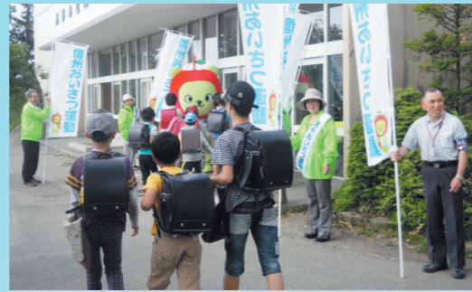
▲「信州あいさつ運動」

現在、長野県、長野県教育委員会、長野県警察本部、長野県連合婦人会、長野県子ども会育成連合会、長野県PTA連合会、長野県経営者協会など県内の120を超える団体や個人が参加しています。