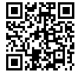
少年の主張動画一覧 (県民会議 HP)

日々の生活で感じたこと、未来への希望や夢。中学生らしく純粋な言葉で力強く主張されていました。